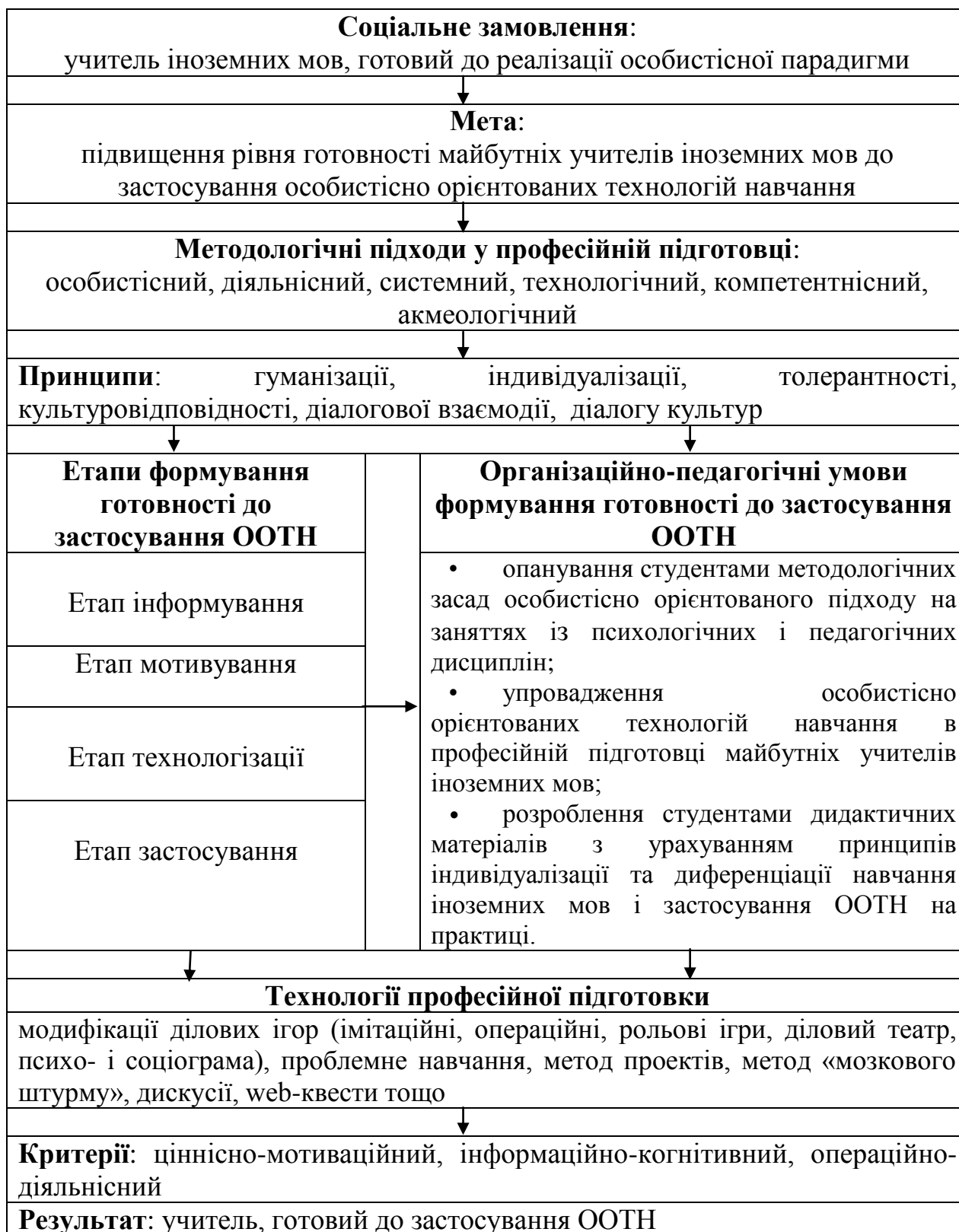
Рис.2.1. Модель формування готовності майбутніх учителів іноземних мов до впровадження ООТН

цілісний і динамічний процес, у якому мають бути враховані потреби суспільства й особистості (рис.1).